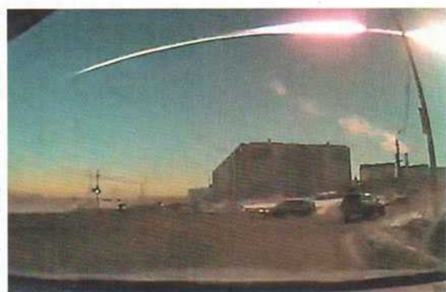
▲ Когда в Челябинске упал метеорит, в Интернете появилось множество записей катастрофы, сделанных водителями. Ведущий американской телепрограммы The Daily Show Джон Стюарт посвятил целый выпуск «безумным русским», которые ставят камеры в автомобилях, и долго смешил зрителей, но так и не понял, от кого и как защищают эти приборы

Причину происходящего до сих пор никто внятно не сформулировал, нет и стопроцентных способов лично избежать такой ситуации. Но вместе с экспертами мы попытались проанализировать некоторые трагичные или показательные эпизоды, чтобы хотя бы примерно понять, где «подстелить соломку», чтобы не стать жертвой или (всякое бывает) виновником преступления.