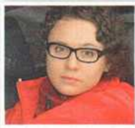
Фото: автор, В. АРТЕВ, PhotoXpress, В. БОРИСОВ, рис.: А. ГАЛАГАНОВ

Вы не пьете за рулем и никогда не нарушаете? Это правильно, но не думайте, что при встрече с нерадивыми гаишниками вам ничто не угрожает. С нашего читателя такие инспекторы-коррупционеры «состригли» 60 000 руб., угрожая арестом из-за... погрешности алкотестера. О том, как обманывают водителей, рассказывает Екатерина КВАШЕНКИНА